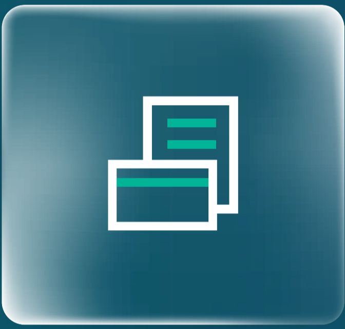
نماذج منتجات بنك الرياض Riyad Bank products forms