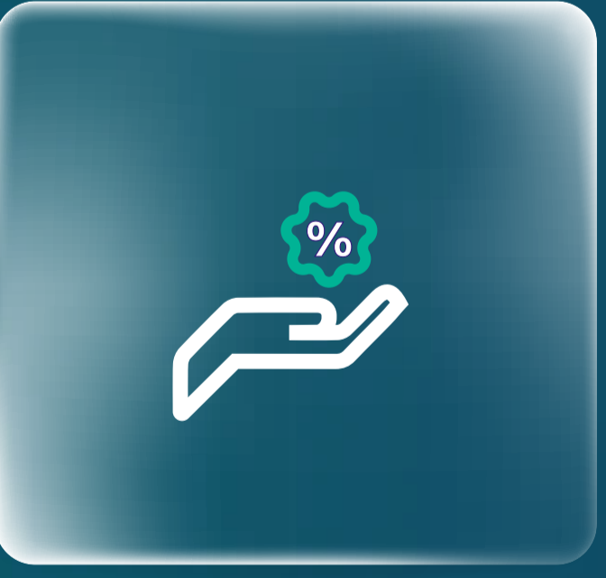
اكتشف عروضنا Check Our Offers