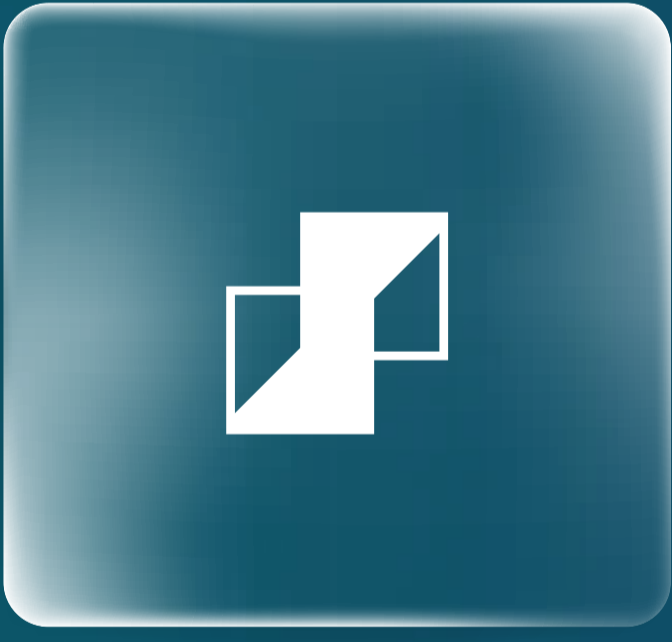
الرياض المالية Riyad Capital