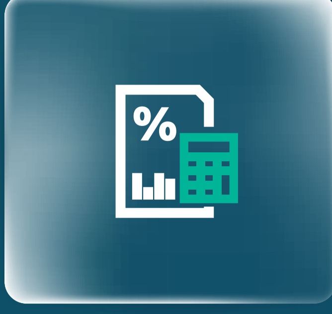
قائمة رسوم الخدمات المصرفية للأفراد List of Retail Banking Services Charges