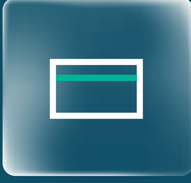
البطاقات الائتمانية Credit Cards