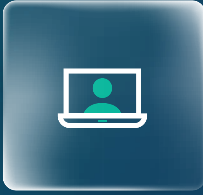
فتح الحساب الجاري Retail Account Opening