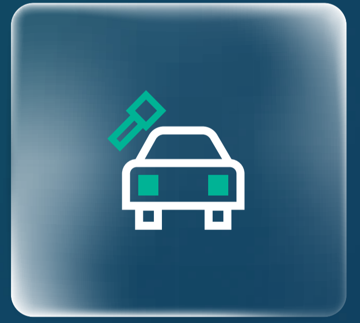
برنامج التمويل التأجيري للسيارات Auto Leasing Program