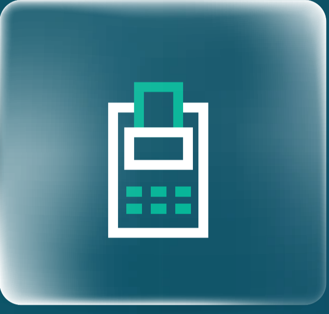
جهاز نقاط البيع Point of Sales