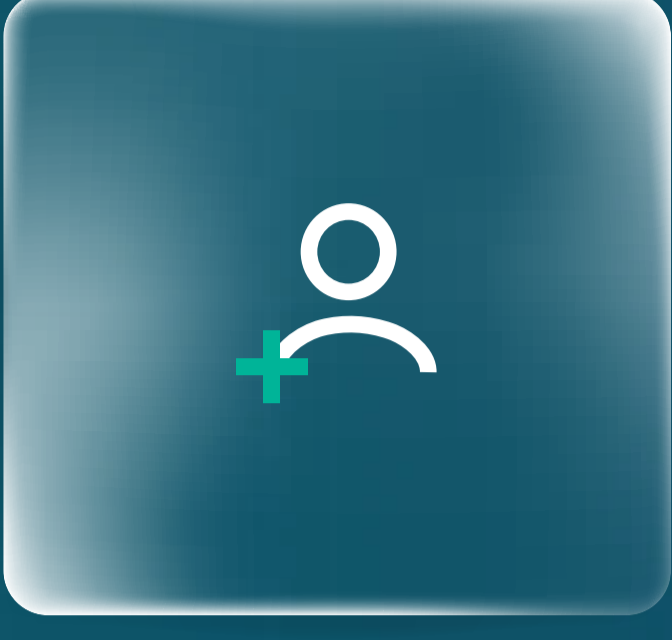
فتح الحساب التجاري Retail Account Opening