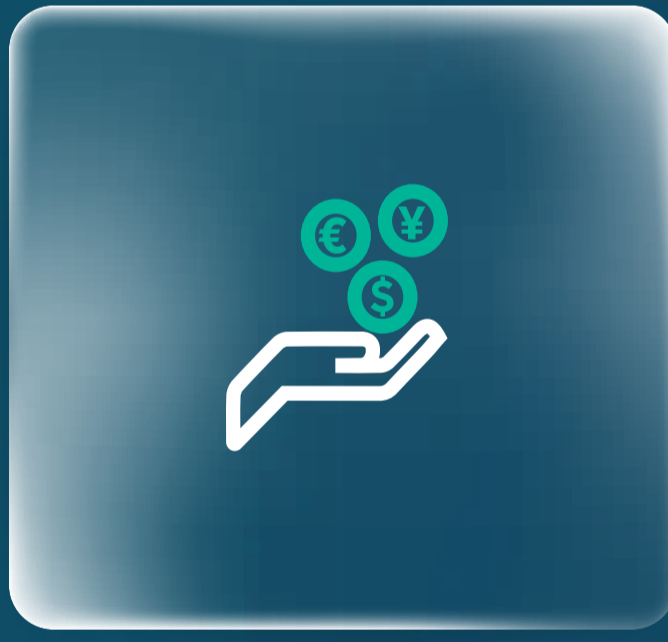
التمويل الشخصي Personal Finance