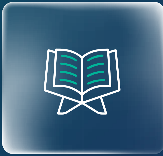
القرآن الكريم Holy Quran