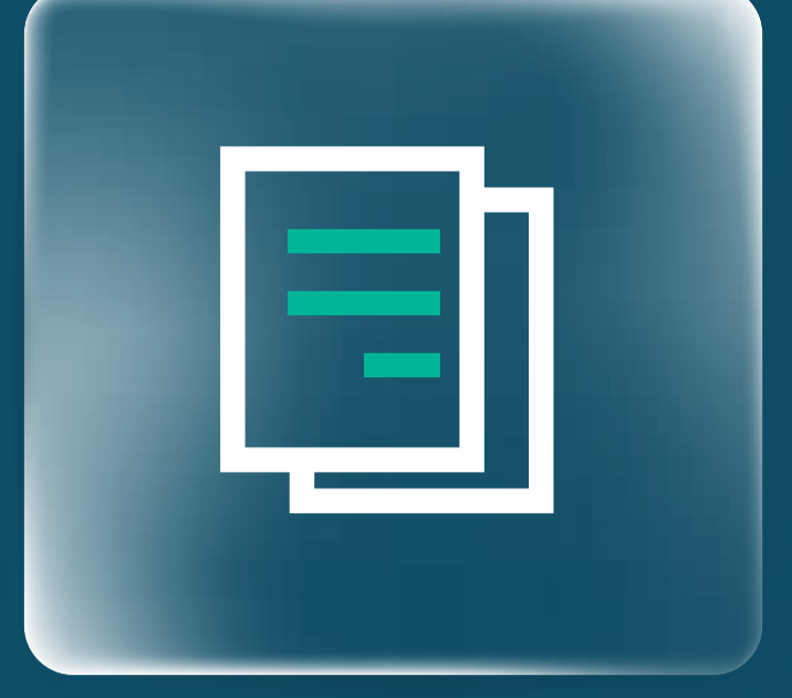
مبادئ حماية عملاء المصارف Customers Banking Principles Protection