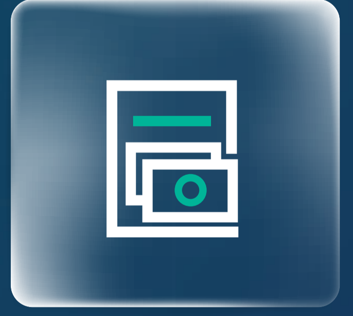
منتجات الخزينة Treasury Products