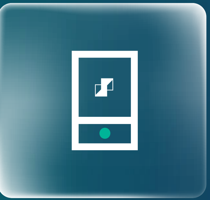
حمل التطبيق Download the App