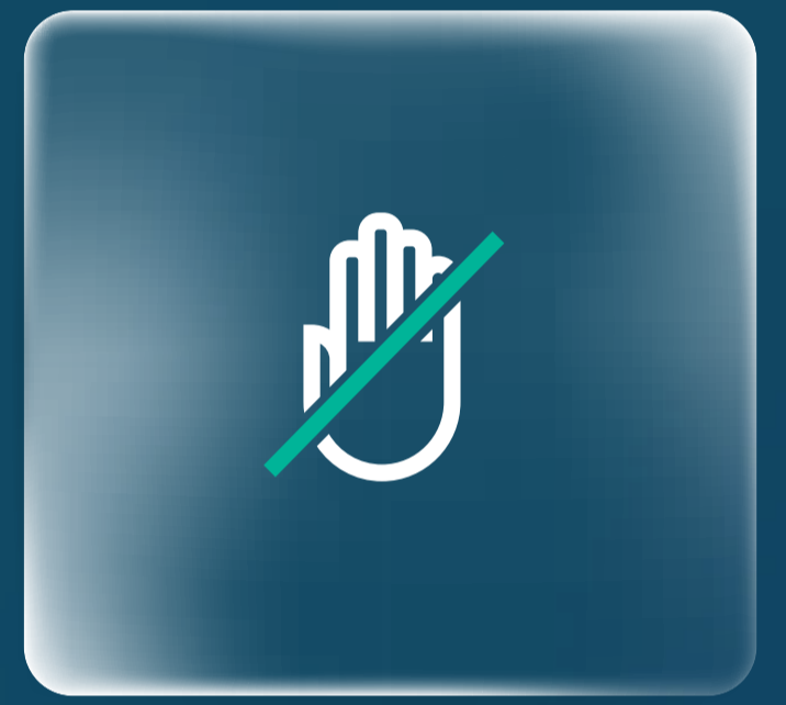
خدمة الدفع "بدون لمس" "Contactless" Payment Service