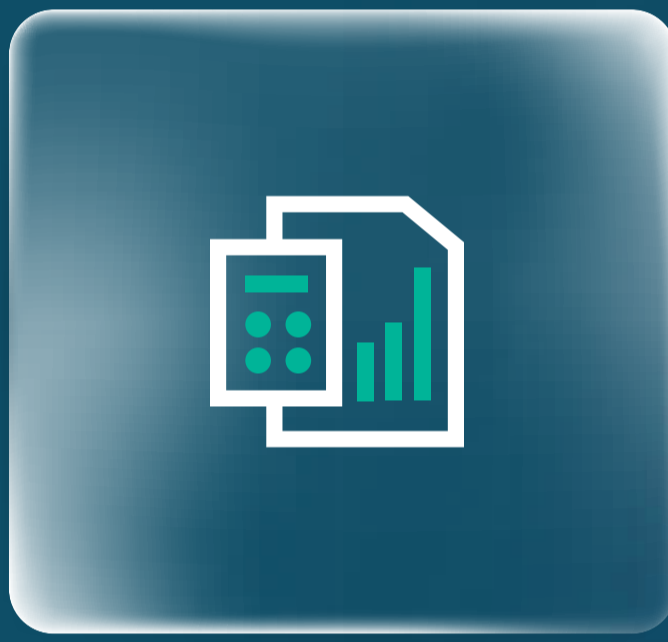
الرياض المالية للتمويل Riyad Capital Financing