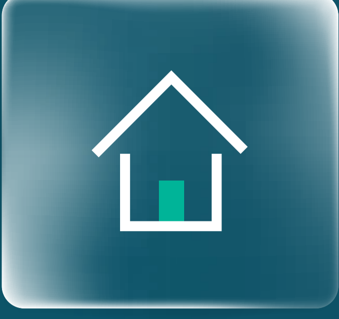
التمويل العقاري Mortgage Finance