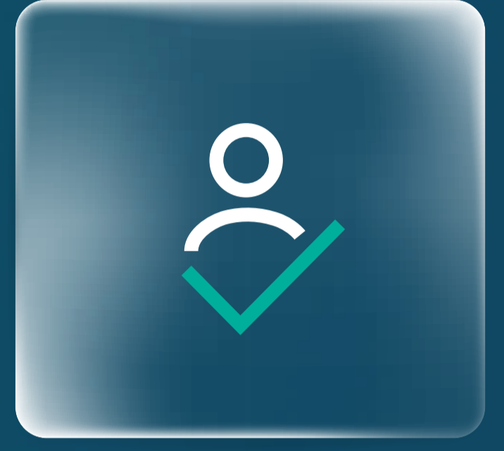
إدارة العناية بالعميل Customer Champions Division