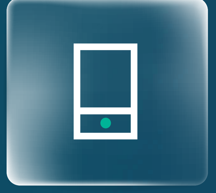
خدمة Riyad Pay Riyad Pay Service